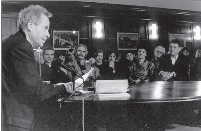
LES VOIX (Ed. Descartes & Cie), UTOPIE ET DÉSENCHANTEMENT (Ed. Gallimard), AVOIR ÉTÉ , de Claudio Magris , lecture par François Marthouret . 25 mars 2002.