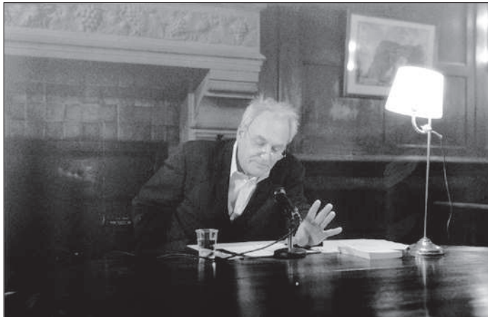
LE CIMETIÈRE AMÉRICAIN (Ed. Champ Vallon), de Thierry Hesse , lecture par Didier Flamand . 19 janvier 2004.