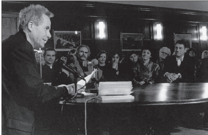
LES VOIX (Ed. Descartes & Cie), UTOPIE ET DÉSENCHANTEMENT (Ed. Gallimard), AVOIR ÉTÉ , de Claudio Magris , lecture par François Marthouret . 25 mars 2002.