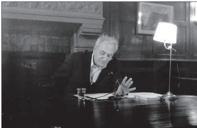
LE CIMETIÈRE AMÉRICAIN (Ed. Champ Vallon), de Thierry Hesse , lecture par Didier Flamand . 19 janvier 2004.