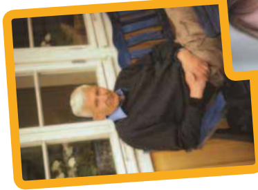
Per Olov Enquist