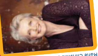
Marie Christine Barrault