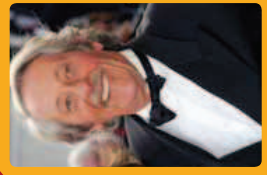
Jean Rochefort